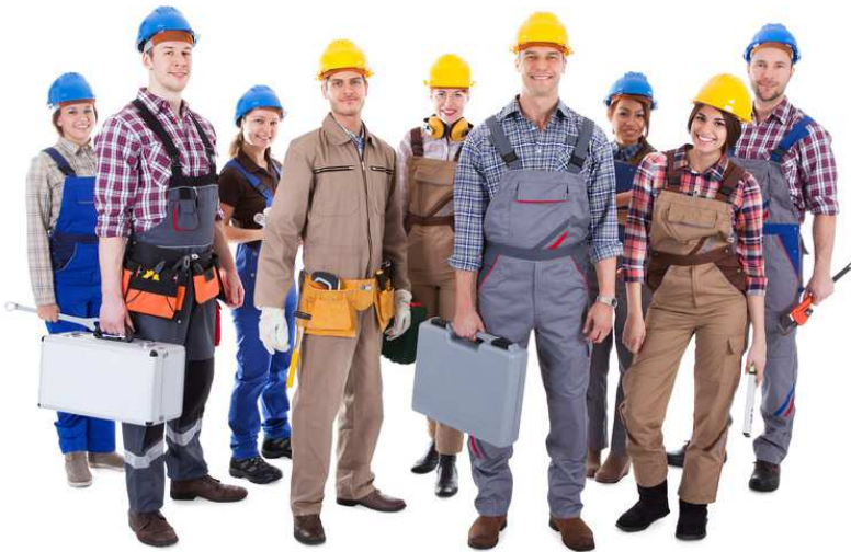
SEPARATER AUSWEIS DER GRUPPE „WERKSTATTLOSE HANDWERKER“ (VAN-PEOPLE)!